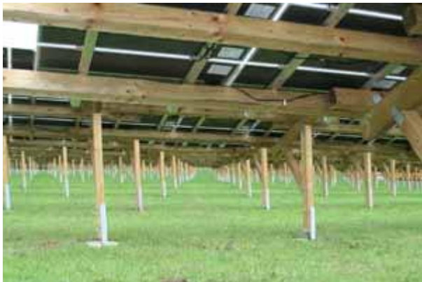
Imposant: Die Module werden von ca. 600 Pfosten gehalten.