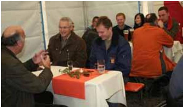
Gäste aus Wirtschaft und Politik sowie ausführende Firmen.