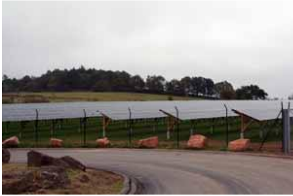
Blick auf den Solarpark Diehl KG im Industriegebiet Fraurombach.