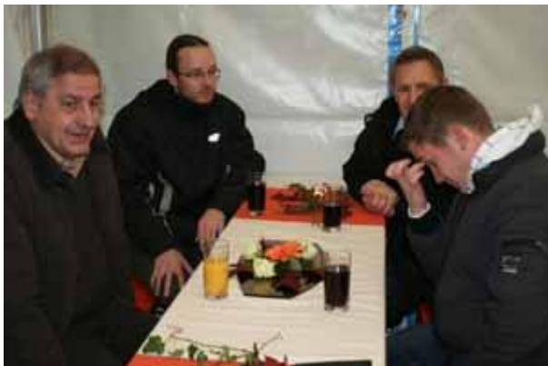
Mitarbeiter des Elektrizitätswerkes beim Fachsimpeln. *****